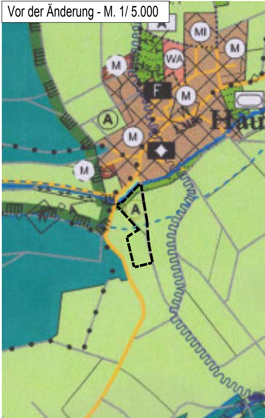
Vor der Änderung - M. 1/ 5.000